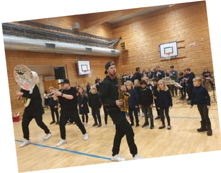
Konsert med Blåsemafiaen oktober 2021